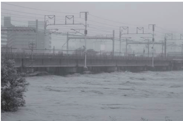
▲架け替えに着手する県道枇杷島橋(写真上)と台風15号で増水した庄内川とJR新幹線橋(写真下)

梁の架け替えについては、早期に実施をしていただくよう強く求めました。 この特定構造物とは、再び東海豪雨と同様な降雨に見舞われても洪水を安全に流下させるために河道掘削や堤防の嵩上げ等の整備を行っていますが、庄内川の狭窄部にある3つの橋梁は、これらの整備を行っても桁