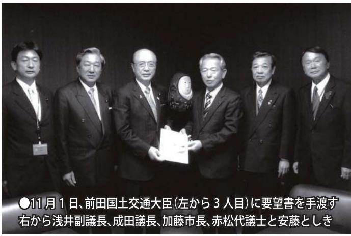
●11月1日、前田国土交通大臣(左から3人目)に要望書を手渡す 右から浅井副議長、成田議長、加藤市長、赤松代議士と安藤とし

きは、前田国土交通大臣に大臣室で直接行いました。中でも、庄内川の狭窄部にある特定構造物(県道枇杷島橋、JR新幹線橋梁、JR東海道本線橋梁)の3橋